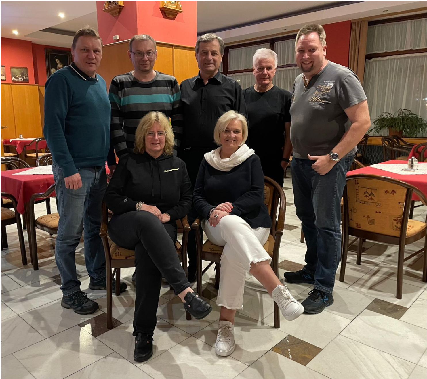
Náš Erasmus-Team 😊