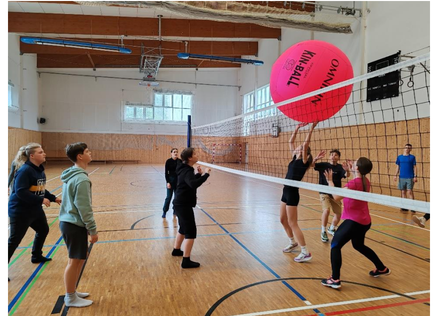
Navštívili jsme i naši sportovní halu a zde si zahráli různé formy Kim Ballu a kdo chtěl, tak si mohl vylézt na stěnu.