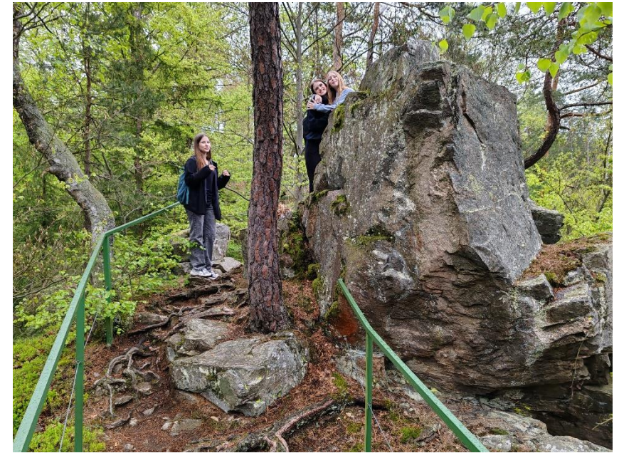
Kdo ale chtěl, mohl se zahřát výšlapem na Sokolohrady. A že nás bylo! Jsou to pašáci.