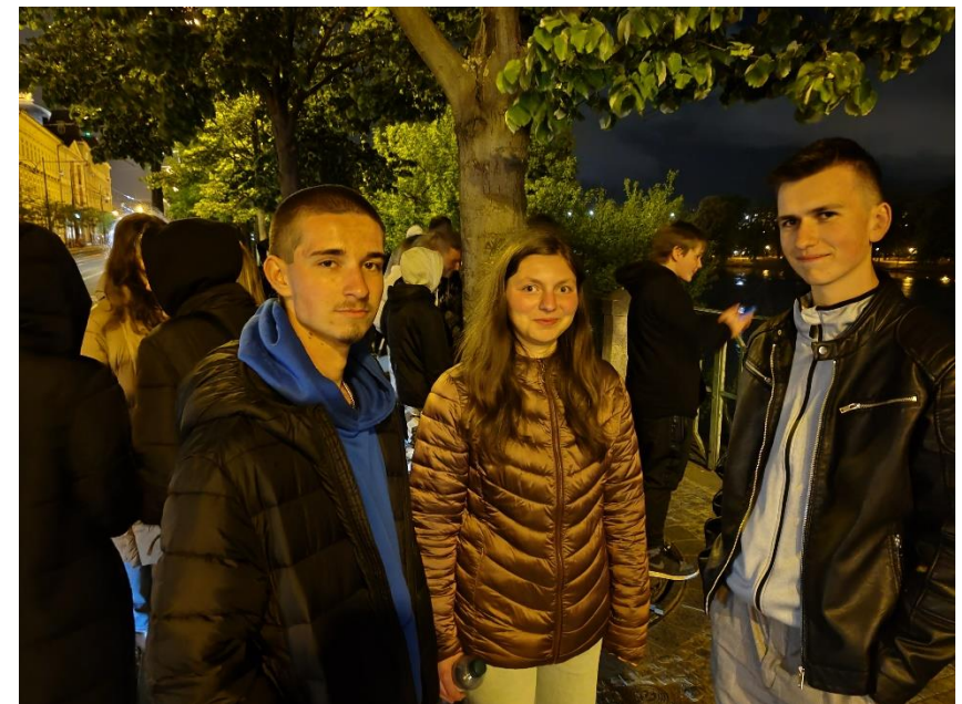
Po ubytování v Praze jsme se rozjeli ještě na noční prohlídku centra. A stálo to za to. Praha je v noci krásně osvětlená. Turistů také méně, takže super.