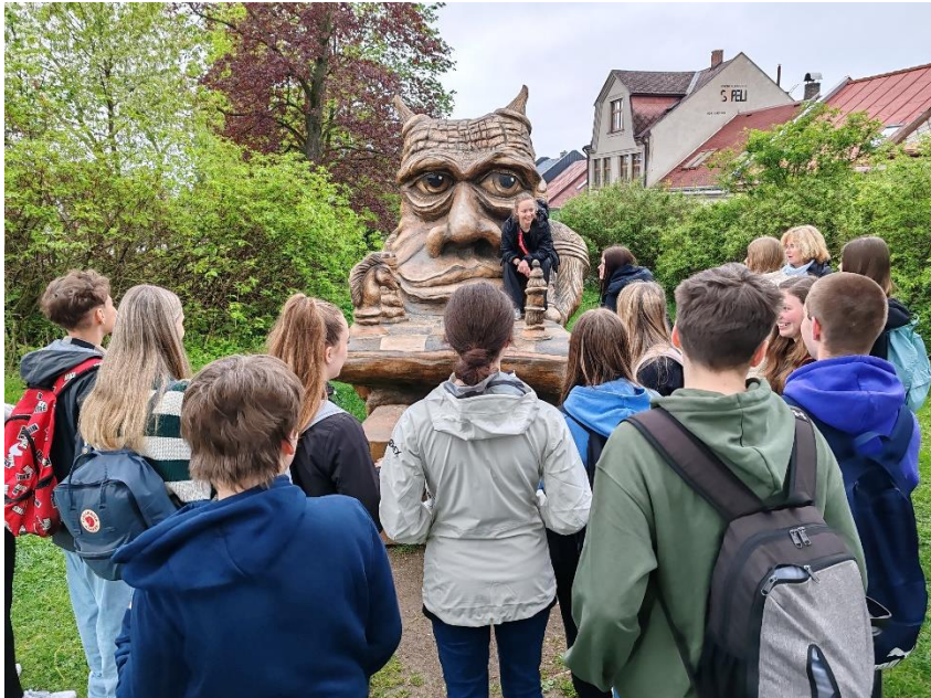
.... a vyrazíme na Doubravku. Napřed povinné foto s čertem a samozřejmě stihnout vlak do Bílku.