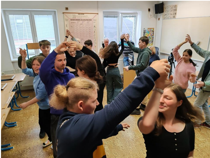
Ale Annemarie-Polku jsme zvládli úplně všichni!