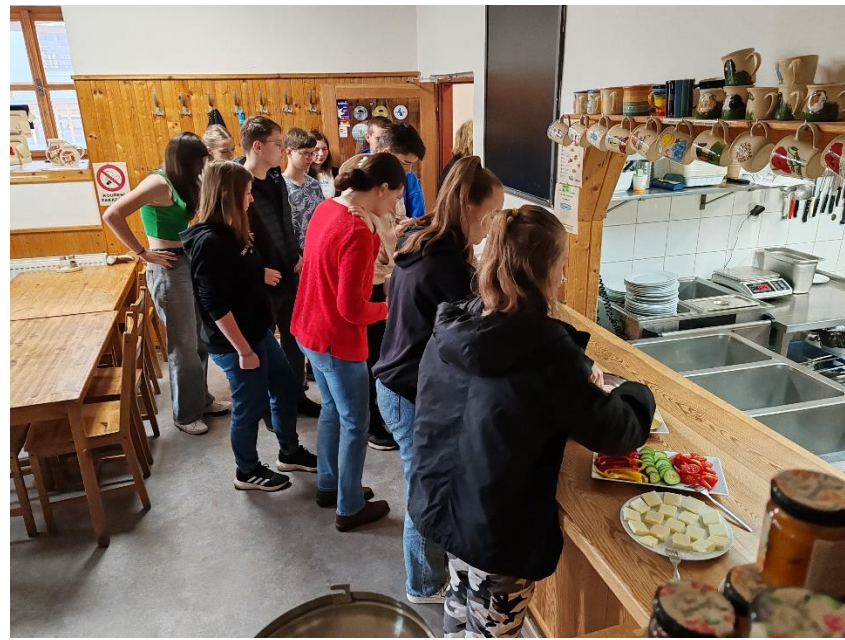
Ráno snídane a pak už zase do Prahy. Tentokrát na Královskou cestu. Jak jinak než přes Petřín.