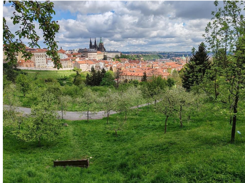
Pak už klasika. Pražský hrad a hurá do centra.