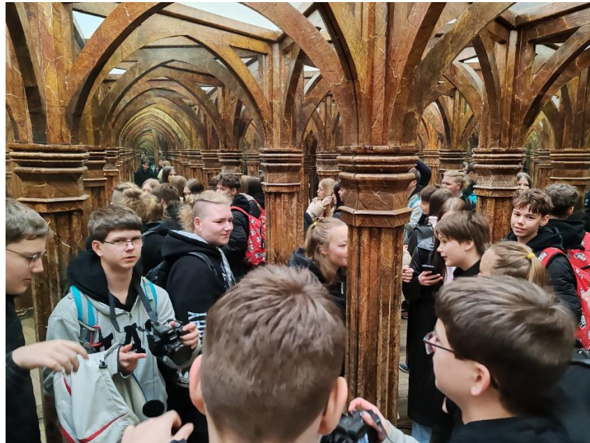
Zrcadlové bludiště a malou Eifelovku jsme nemohli přeci vynechat.