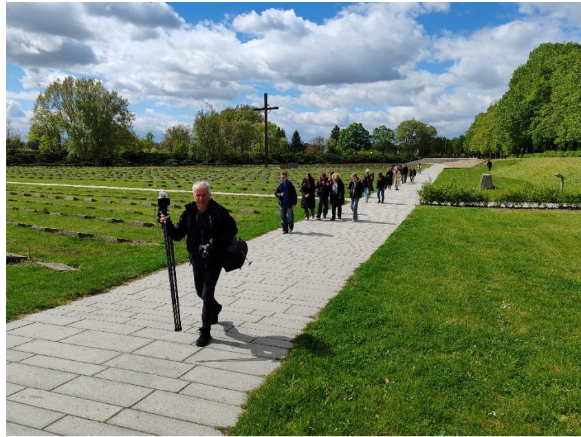
Pevnost upoutala naši pozornost, jen ty hroby...