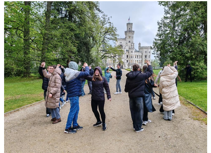
V parku jsme si ještě procvičili to, co jsme se naučili ve škole. Počasí zatím ušlo, ale mraky a zima.