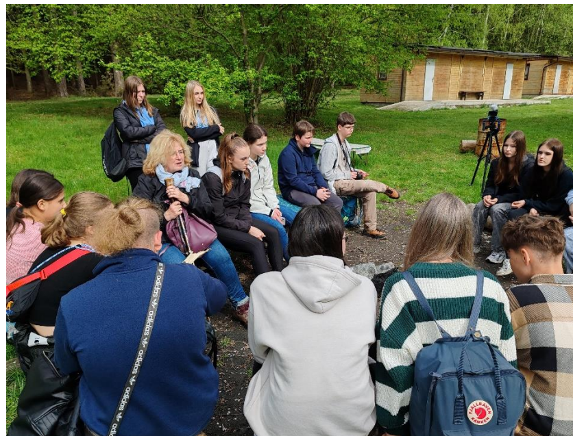
U chaty pak proběhl tzv. Feedback. Ten nechyběl žádný den. A bylo to dobře. Každý se mohl vyjádřit, co se mu líbilo a co ne.