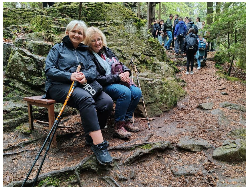
Malé ošetření. Jo, přežít v přírodě není jednoduché. Ale jak je vidět, všichni jsme si to užívali.