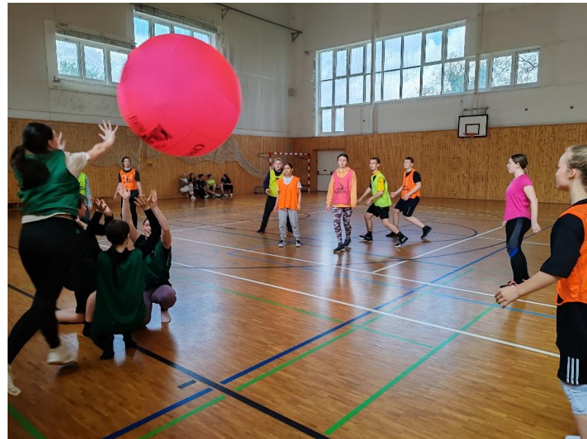
Zde hrajeme klasický Kim Ball. Členy družstva jsme namíchali a bylo to velmi vyrovnané.