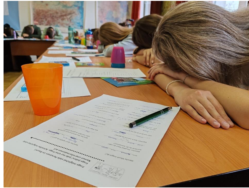
Teď trochu odpočinku, relax...