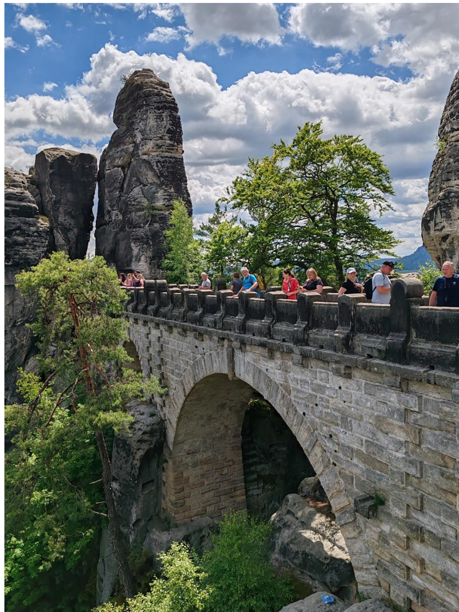
Alespoň několik top pohledů pro ty, co s námi nebyli. 😊